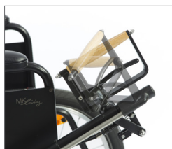
Lenkung am Hebel